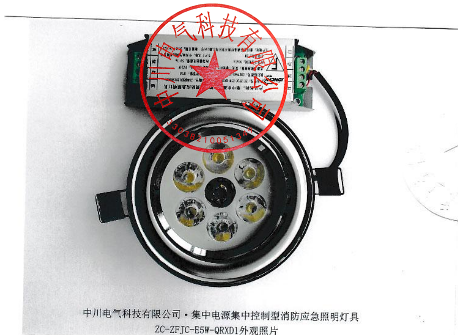
中川电气科技有限公司·集中电源集中控制型消防应急照明灯具 ZC-ZFJC-E5W-QRXD1外观照片