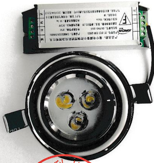
中川电气科技有限公司·集中电源集中控制型消防应急照明灯具 ZC-ZFJC-E3W-QRXD2外观照片