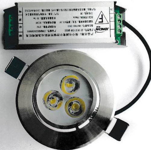
中川电气科技有限公司·集中电源集中控制型消防应急照明灯具 ZC-ZFJC-E3W-QRXD3外观照片